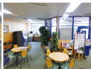
ラウンジ (約144平方メートル) ・テーブル個数: 4個・椅子個数: 20脚 ・50インチ液晶テレビ・DVDプレイヤー